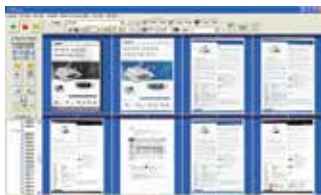
Pantalla principal de AVScan X

-Herramienta de gestión inteligente de documentos Herramienta