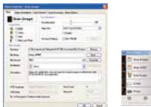
Pantalla principal de Button Manager V2

Button Manager V2 hace que sea fácil escanear y enviar la imagen a sus destinos favoritos con solo pulsar un botón. Ahora la nueva versión viene con una característica innovadora que le permite escanear y subir el documento escaneado a los repositorios nube populares como Google Docs, Microsoft SharePoint, o FTP de forma automática. Además, la función de iScan le permite insertar la imagen escaneada o el texto reconocido después (Reconocimiento Óptico de Caracteres) a su editor de texto como Microsoft Word para realizar su trabajo con facilidad y rapidez.