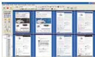
Pantalla principal de AVScan X

-La herramienta inteligente de gestión documental