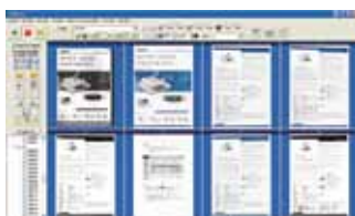
Pantalla principal de AVScan X

-La herramienta inteligente de gestión documental