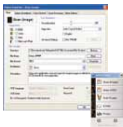
Pantalla principal de Button Manager V2

-Completa tu digitalización en un sólo paso