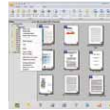
The PaperPort SE14 main screen

- La Elección Profesional para Organizar y Compartir tus Documentos