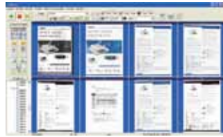
The AvScan 5.0 main screen

-La Herramienta de Administración de Documentos Inteligente