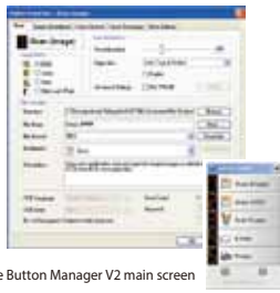
The Button Manager V2 main screen

Button Manager V2 facilita tu escaneo y el enviar imágenes a tus destinos favoritos con sólo presionar un botón. Ahora la nueva versión viene con una característica innovadora que te permite escanear y subir automáticamente un documento escaneado a un depósito en la nube popular como Google Docs, Microsoft SharePoint, o un FTP. Además, la función del iScan te permite insertar la imagen escaneada o el texto reconocido después de un proceso de OCR opcional a un editor de texto como Microsoft Word para realizar tu trabajo rápida y fácilmente.